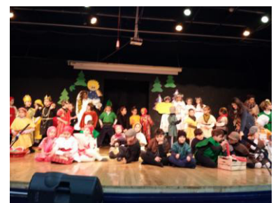
W Il Natale!!!