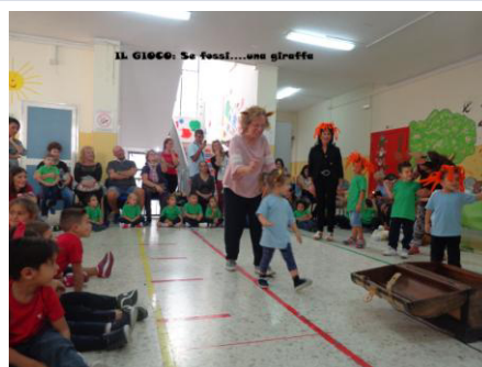
Festa dei nonni Verdolino infanzia